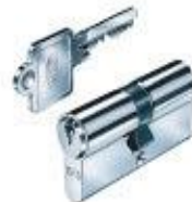
C11 Standard- Profilzylinder